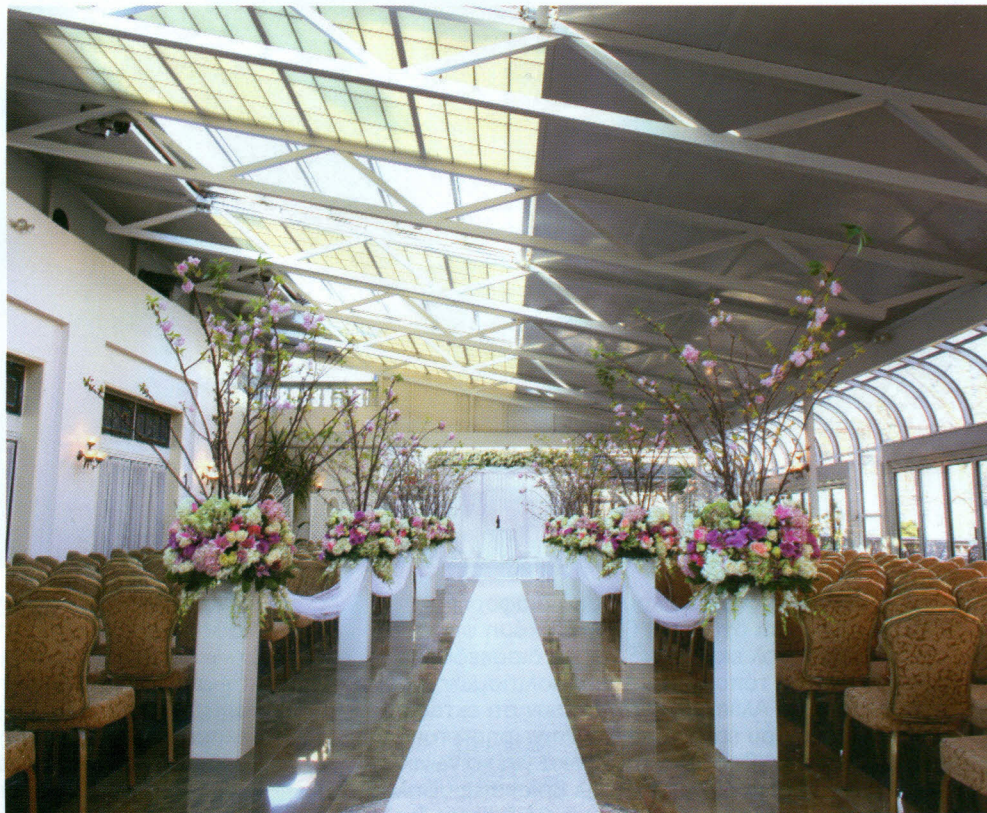
Μια από τις αίθουσες του Γκραντ Πρόσπεκτ Χολ, στο Μπρούκλιν.

«Έφτασε η στιγμή που πρέπει να έχουμε κοντά ένα ξενοδοχείο, ώστε αρκετός κόσμος που επιθυμεί, να έχει τη δυνατότητα να διανυχτερεύει εκεί. Και το ξενοδοχείο δε θα βοηθήσει μόνο τη δική μας επιχείρηση, αλλά πολλές άλλες επιχειρήσεις της περιοχής».